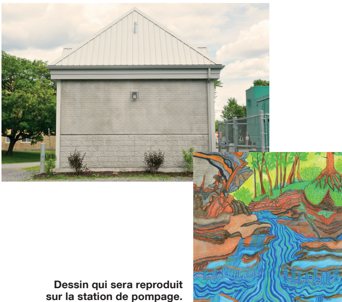
Dessin qui sera reproduit sur la station de pompage.

Venez voir le résultat final cet automne !